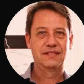
Gestor Financeiro / RH