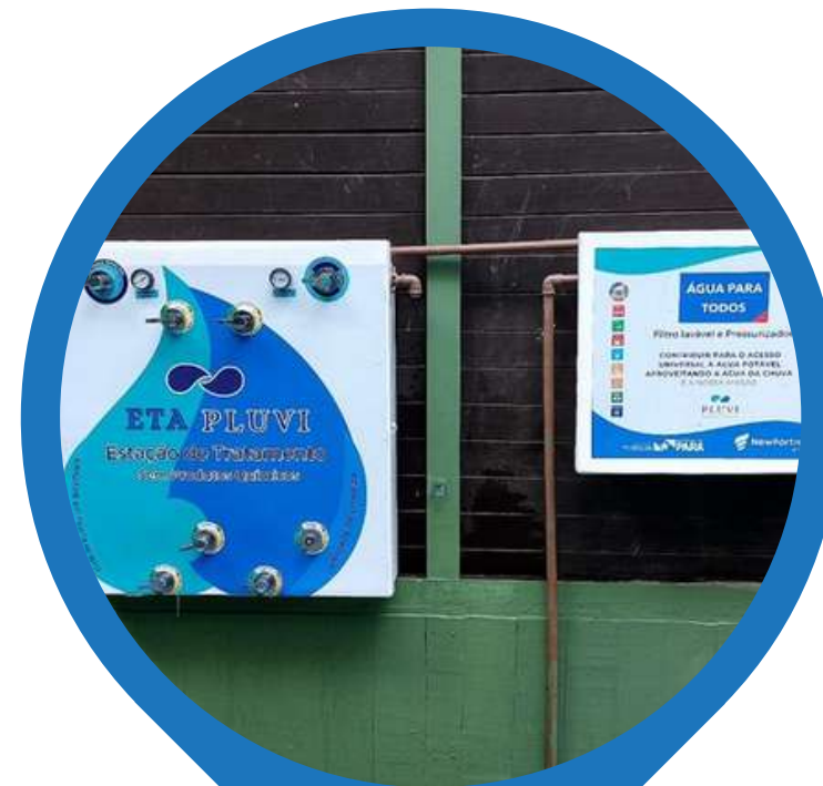
Belém - PA