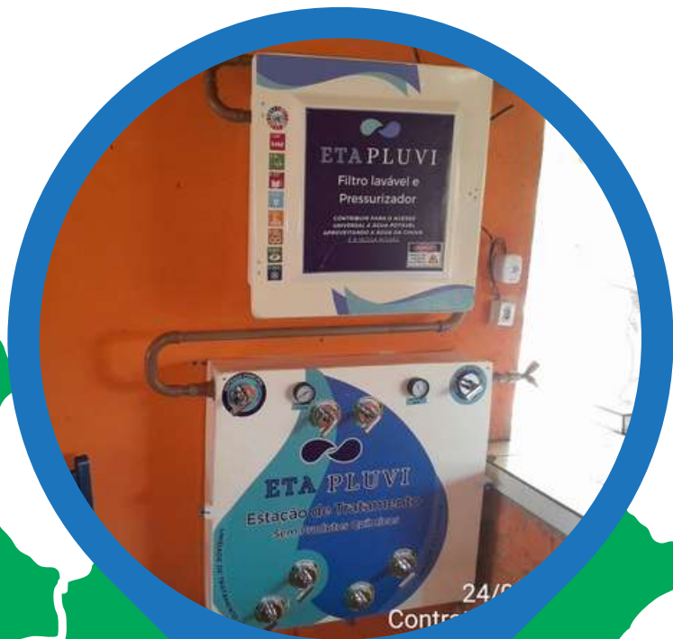
Altamira - PA