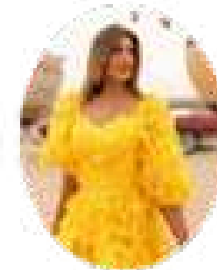
LORE IMPROTA 16,4 M seguidores