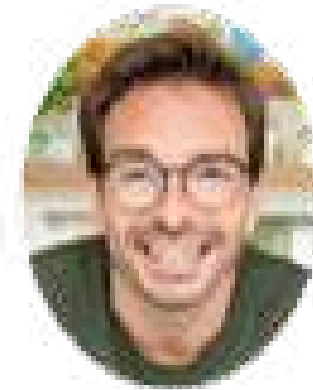
BETTOAUGE 4,6 M seguidores