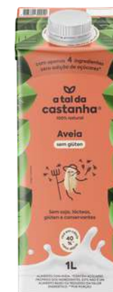
Lançamento da bebida Aveia

Joint venture com 3corações. Oficialização de Positive Brands, unindo Família Carvalho + 3C