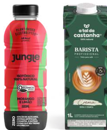
Lançamento do Barista e Jungle

Anúncio da Positive Brands, buscando a transformação em uma empresa independente