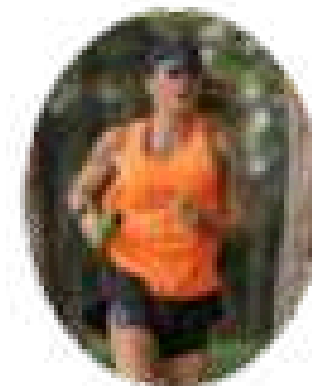
DANIELLA CICARELLI 556 mil seguidores