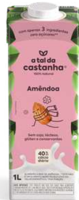
Lançamento da bebida Amêndoa