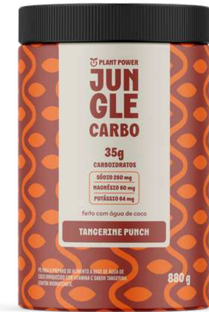
Jungle Carbo - Pote