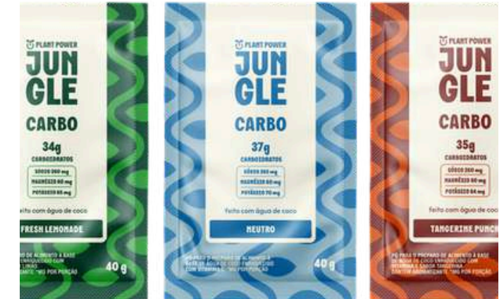
Jungle Carbo - Sachê