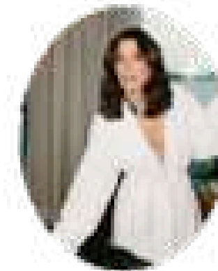
CAMILA COUTINHO 3,3 M seguidores