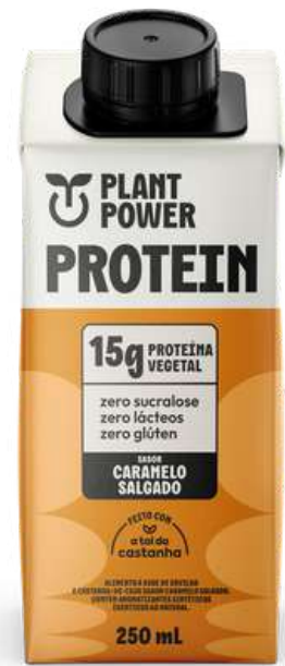
Shake Protein Plant Power