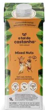
Lançamento da bebida Mixed Nuts