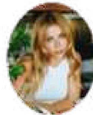
JADE PICON 21,5 M seguidores