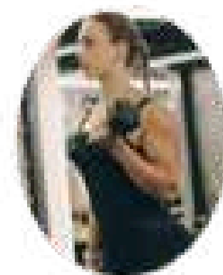
MANU CIT 1,6 M seguidores