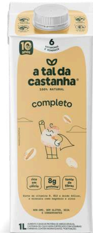
Completo A Tal da Castanha