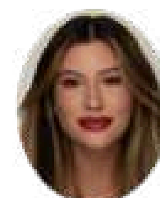
NINA SECRETS 3,7 M seguidores